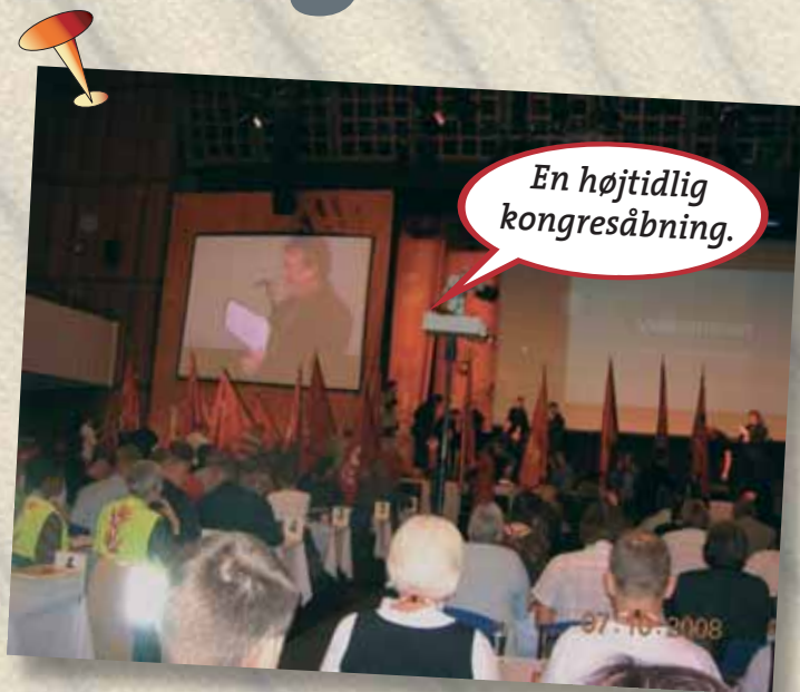
En højtidelig kongresåbning.