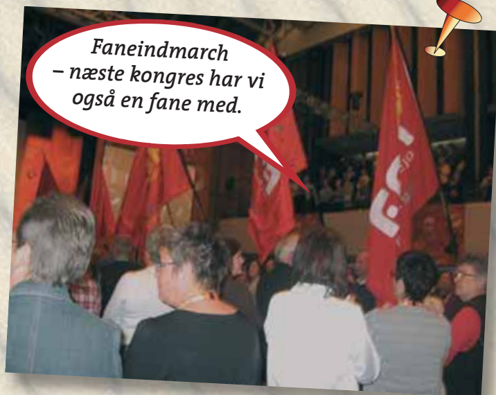
Faneindmarch - næste kongres har vi også en fane med.