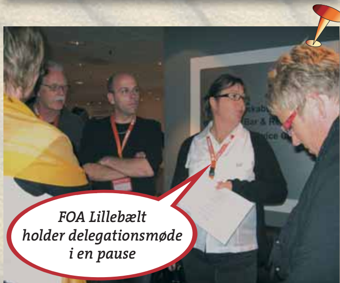
FOA Lillebælt holder delegationsmøde i en pause