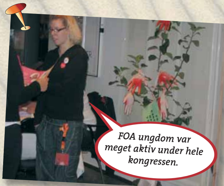
FOA ungdom var meget aktiv under hele kongressen.