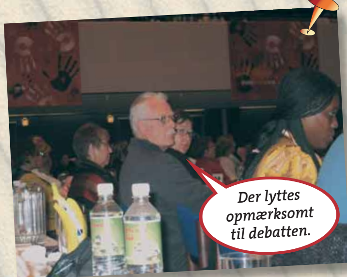
Der lyttes opmærksomt til debatten.